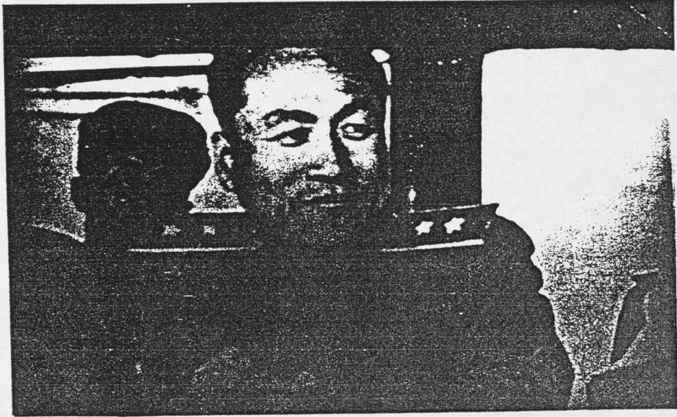
1953년에 개성정전 담판회에서 활동하실시 리 상 조 장 준.