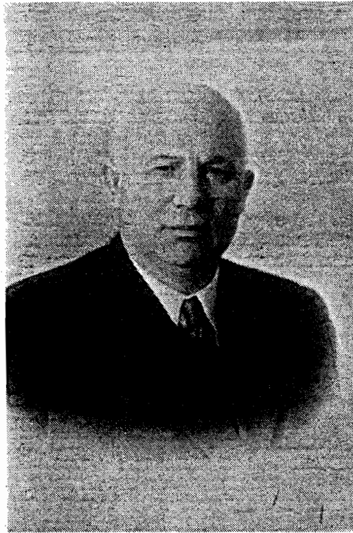
Н. С. Хрущев.

Совместное заседание Пленума Центрального Комитета КПСС, Совета Министров СССР и Президиума Верховного Совета СССР единогласно утверждает внесен-