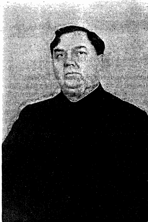
Г. М. Маленков.