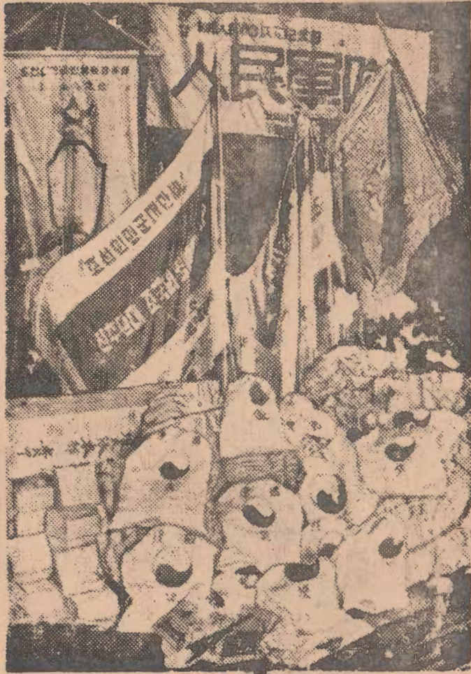
人民軍에게 보내온 山積한 人民들의 獻旗의 餽物