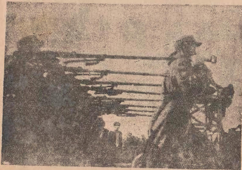
製戰車砲部隊의 行進하는 光景