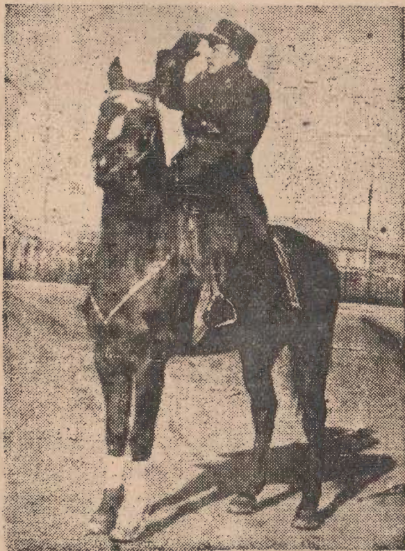
總司令 崔庸健 是 騎兵