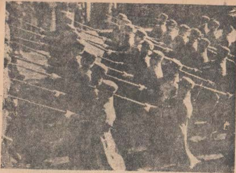
步兵部隊의 行進하는 光景