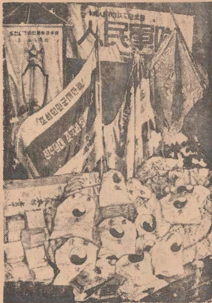
人民軍에게 보내온 山積한 人民들의 獻旗의 餽物